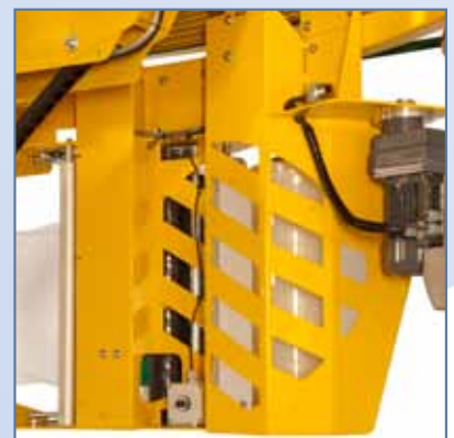
2. Främre vy på "S-carriage" filmvagn.