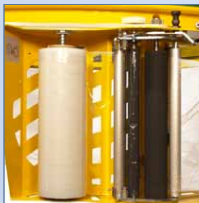
1. Bakre vy på "S-carriage" filmvagn.